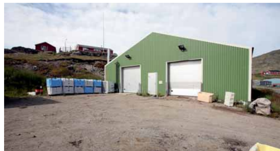
Unscheinbar steht das Gebäude des Greenland Brewhouse im Hafengebiet von Narsaq. In den blauen und weissen Boxen wird das Eis angeliefert.

«Meine Leidenschaft für Bier ist während eines längeren Arbeitsaufenthalts in Deutschland entflammt, wo Bier eine Art Nationalgetränk ist», erzählt Hard. «Einige Jahre später habe ich den Trend beobachtet, dass überall – insbesondere in Dänemark –