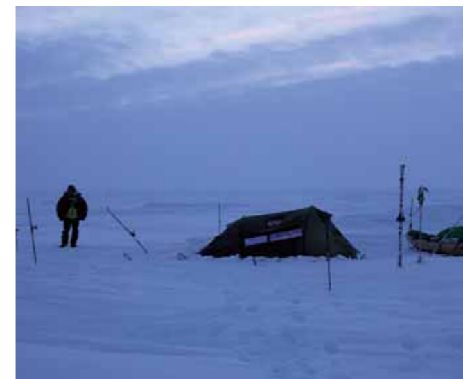
Das Nachtlager ist ausgesteckt. Die Stöcke sind mit Drähten verbunden, die eine Leuchtpetarde auslösen, sollte ein Eisbär zu nahe kommen.