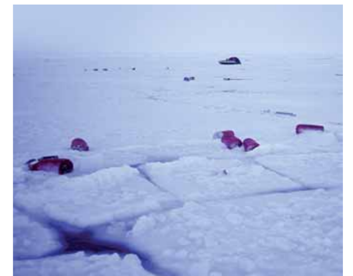
Nach dem Sturm: Das Zelt ist zerfetzt und ein grosser Teil der Ausrüstung in alle Winde zerstreut. Das Schlimmste: Das Eis ist aufgebrochen.