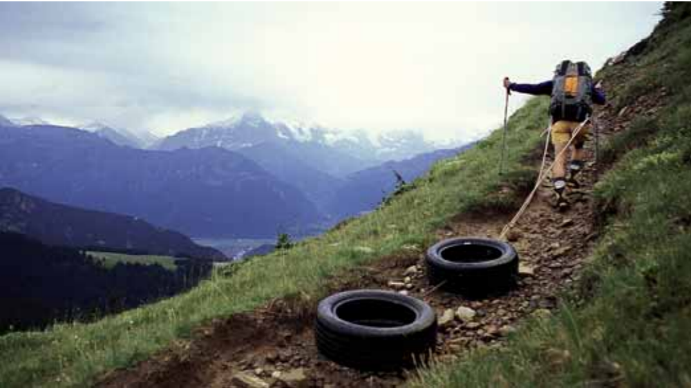
Wochen- und monatelang trainierte Thomas Ulrich in den Berner Oberländer Alpen Kraft und Kondition. Das Gewicht der Reifen entspricht demjenigen des Expeditions-Schlittens.